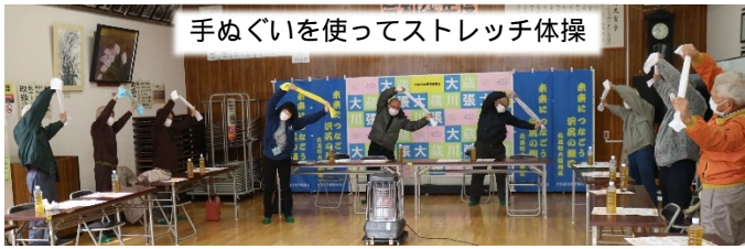
手ぬぐいを使ってストレッチ体操