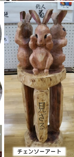
チェンソーアート