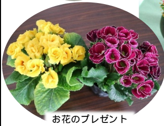
お花のプレゼント