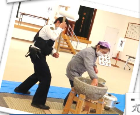
丸森地区 食の祭典