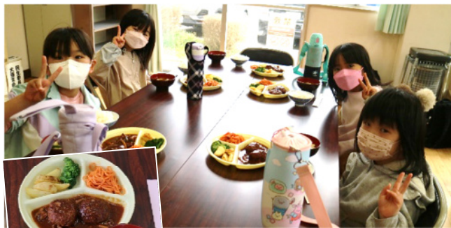
煮込みハンバーグ/ナポリタン フライドポテト/ブロッコリー 白米(つや姫)/お味噌汁