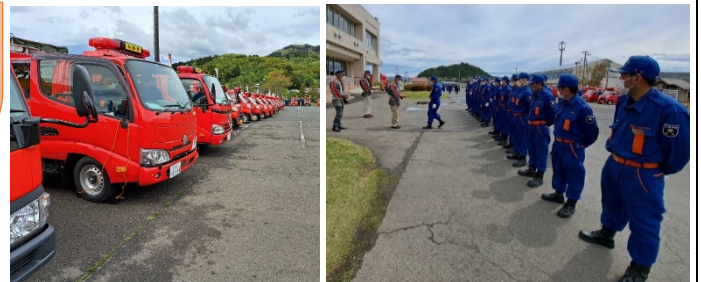
消防団の皆さん早朝より大変ご苦勞様でした。

4月16日（日）令和5年度丸森町消防団春季消防演習が実施され、大張地区でも分団員が参加しました。