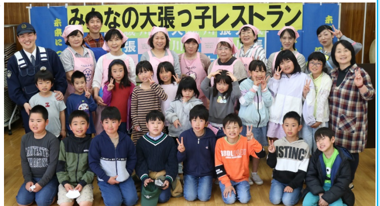
美味しいランチごちそうさまでした(*^_^*)