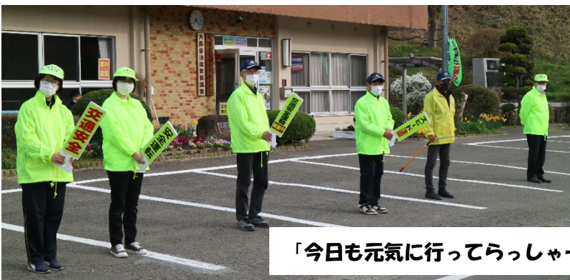
「今日も元気に行ってらっしゃーい！」