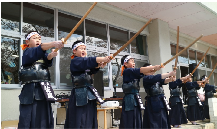
大張・耕野の少年剣士たち！ 凛々しくもあり、たくましくもありかっこいいです！

4月9日（日）、おおはりの「桜を見る会」を開催しました！今回が初めての企画となるイベント「桜を見る会」は、開催に至るまで地域の方々、また関係者の方々にたくさんのお知恵やお力、ご協力をいただきました。本当に感謝感謝のイベントとなりました。開催当日の朝は、雪がちらつき風も強く少し肌寒さを感じる天気でしたが、集まった参加者は100名を超えるほどに！花見がはじまると暖かな日が差し込み…しかし風は強く。それでもそこには、桜吹雪と共にたくさんの笑顔が見られました。久しぶりに地域住民との交流ができ、大盛会のうちに終了となりました。