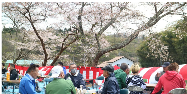
色々な大張の姿が見られました。