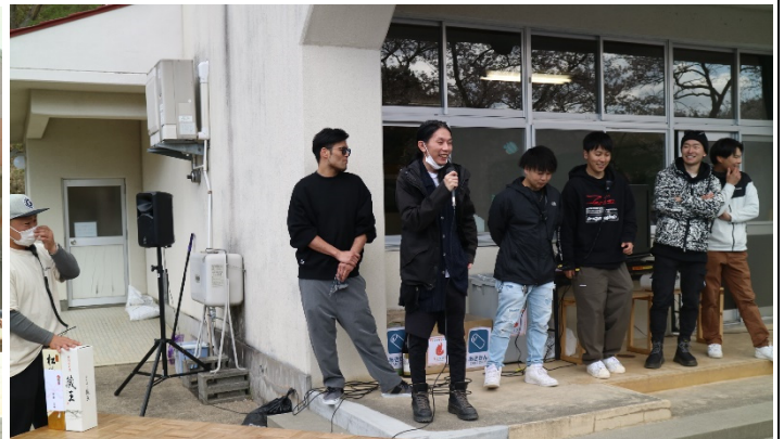
MKフィットネスメンバー・日々鍛えております！ 皆さんも、ぜひMKフィットネスをご利用下さい。