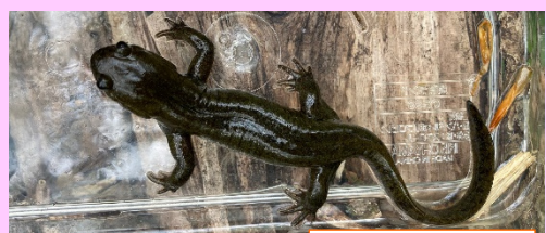
クロサンショウウオ

今年も折り返しになります。早すぎます。だんだん夏に近づくと音楽以外の活動、YouTuberが忙しくなってきます。先日とある県に行き、池をガサガサして天然メダカを網ですくおうとしたら池に落ちました(笑)大張も自然が豊かではありませんが、天然メダカはおそらくほぼ生息していないのでは?と思います。農薬の使用や用水路が整備されたことにより本来の里山の環境ではなくなってきているのかもしれない。私たちの暮らしはとても豊かで便利になったのと引き換えに何かを失ってしまっている...そう感じています。とはいえ不便な暮らしに戻れるか?と言われたら無理ですよ(笑)最近感じるのがトンネル脇や道路脇にゴミが沢山捨ててあることです。ここ数年でグッと増えたような...袋ごと捨ててあるゴミを見て怒りさえ込み上げてきます。タバコの吸い殻のポイ捨ても多いし。いつか必ず私たちの生活に影響してくることを一人一人理解して生活したいものです。ゴミはちゃんとゴミ箱へ!これ基本です! YouTube「たえたそちゃんねる」配信中