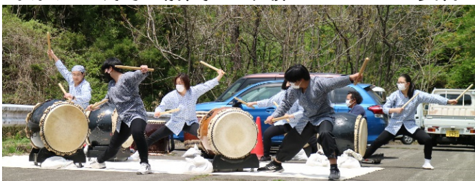
棚田へ移動し和太鼓演奏披露！【童楽娘鼓(どらむすこさん)】