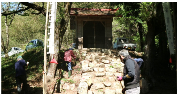
手分けして周辺の清掃等をし、旗を立てみんなで参拝。

4月23日(日)4区春祭りの取材へ出かけました。毎年4月に行われているそうです。朝9時から『牛頭天王社』の清掃や周辺の草刈りを実施。その後に、旗を立て参拝。今年は沢尻棚田で和太鼓演奏の披露があり、盛り上がりました！お昼は沢尻棚田で会食となりました。