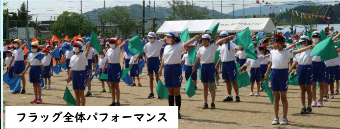
フラッグ全体パフォーマンス