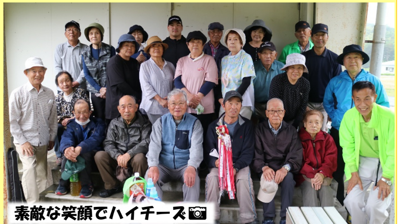
素敵なお笑顔でハイチーズ📷