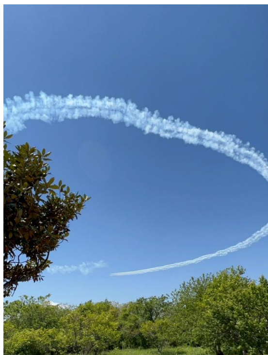
▲ 撮影：中原 天野竹清さん（5/12）