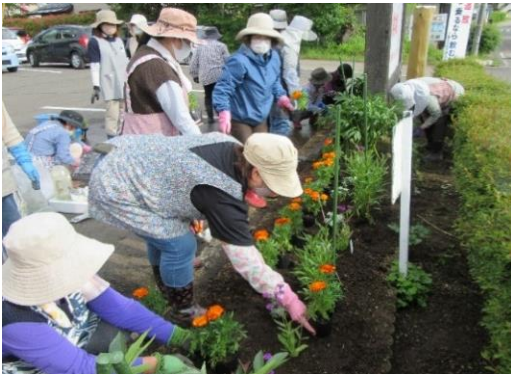
〈 昨年の花植え作業の様子 〉

地区の行事や事業が円滑に行えるよう小斎地区 のためにご協力をいただく“小斎まちサポ女性会”の 会員を募集しています。ご登録だけで会費や役員は ありません。