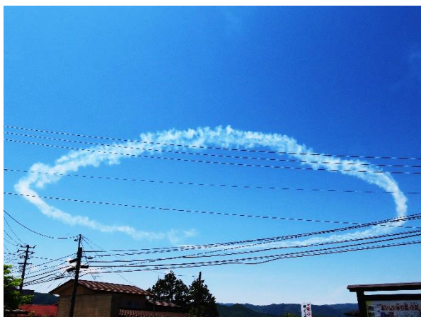
▲ 小斎まちセン駐車場から撮影（5/12）