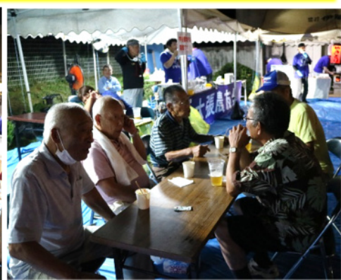
やっぱりいいね！地元のお祭りは…最高！み～んな笑顔。楽しい一夜となりました。出店いただいたみなさん、盆踊り大会盛り上げのご協力、ありがとうございました。また、お手伝い等にご協力をいただいたみなさん、大変ご苦労様でした。そして、大張のみなさん、たくさんのご参加本当にありがとうございました(*^▽^*)