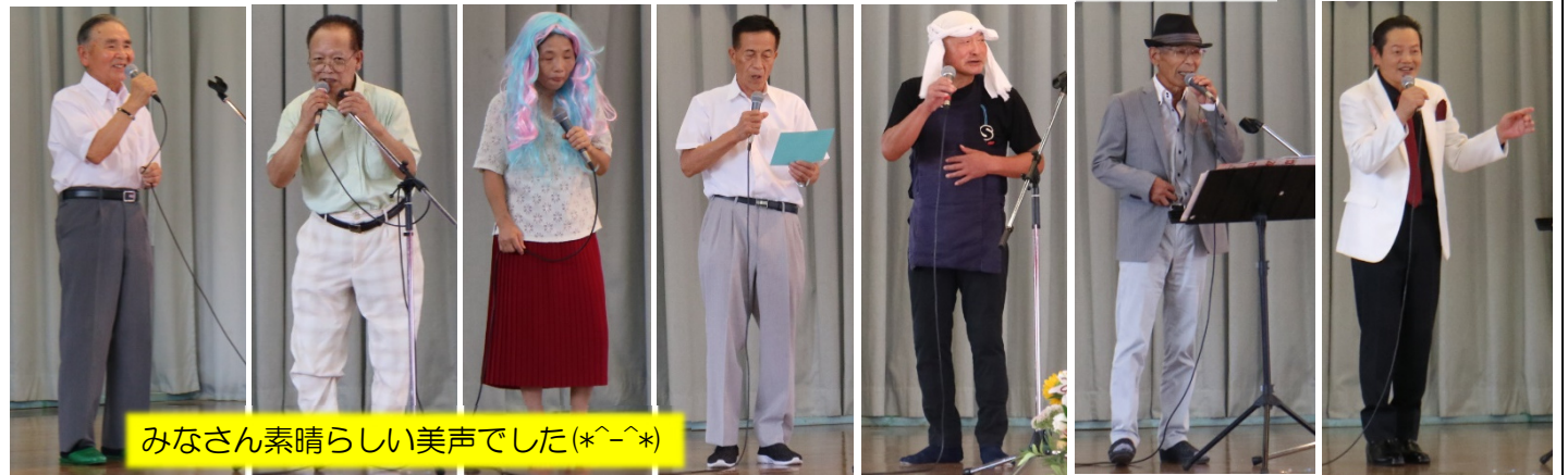
みなさん素晴らしい美声でした(*^-^*)