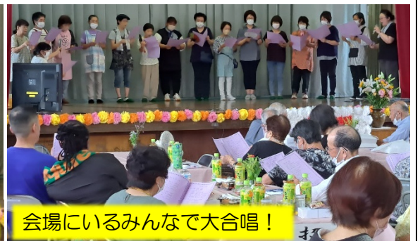
会場にいるみんなで大合唱!

4年ぶりに敬老会とねむたの里ふれあいまつりを開催。多くの方々に お力をいただき無事に終わることが出来ました。大張バンザイ(^-^)