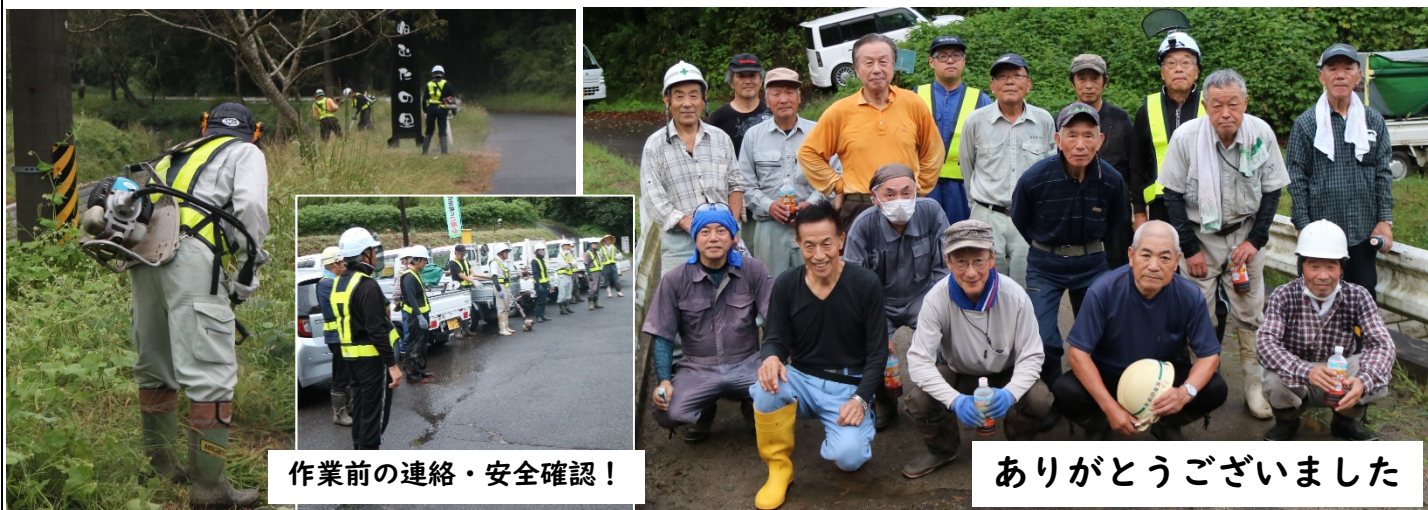
作業前の連絡・安全確認!

9月16日(土)早朝5時半より第2回目となる、ねむの里草刈りを実施しました。前日の雨で少し足元の悪い中でしたが、19名の方にご協力いただき、ねむの木の周辺や道路脇の草をきれいに仮払いしていただきました。今年は暑さのせいか開花の時期が少しずれたようでしたが可愛らしい花を咲かせました。今後も皆さんにご協力をいただきながら『ねむたの里大張』を大切に守っていかれたらと思います。