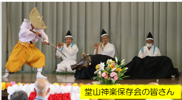
堂山神楽保存会の皆さん