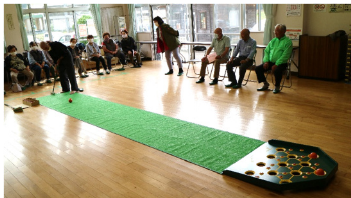
お誕生を迎えられた皆さんおめでとうございます

9月26日(火)、大張まちづくりセンターを会場に大張長寿会前期誕生会が開催されました。今回の誕生会ではまちづくりセンターにあるニュースポーツをやってみよう!ということで、参加された皆さんに「スカットボール」を楽しんで頂きました!