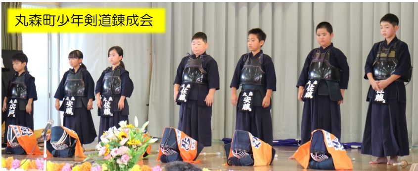
丸森町少年剣道錬成会