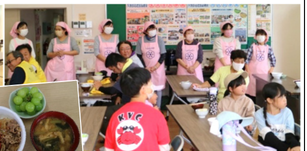
皆さん、来年も参加して下さいね(^^)