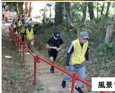
風景を見ながら歩いて歩いて