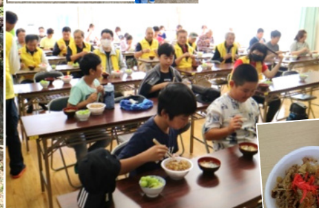
牛丼、本当においしかったです！