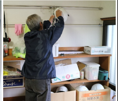
各地区で行われた訓練の様子