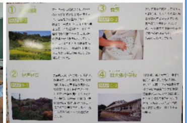
大張マップの拡大図や紹介スペースもありました。