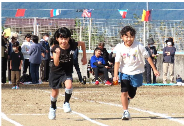
小学生も元気いっぱい!