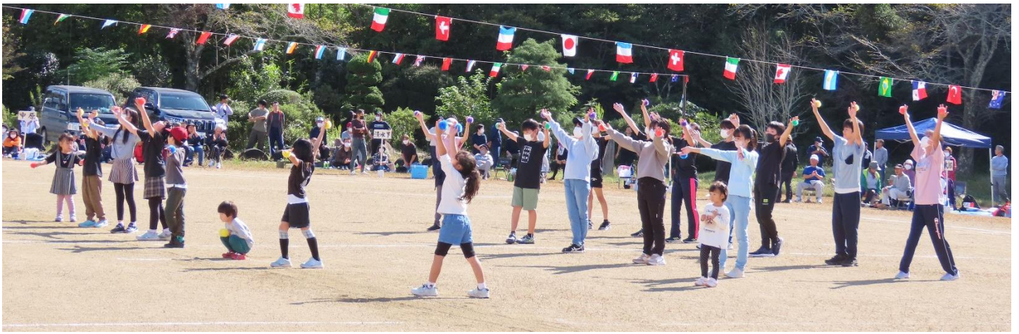
小斎っ子たちがダンスを披露！拍手喝采！