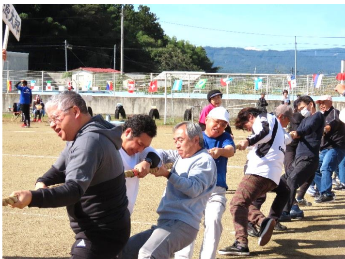
新たな綱引き王者、源太郎チーム!