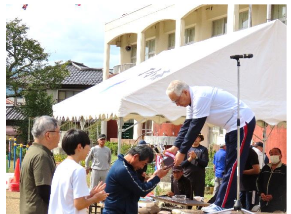
部門別の優勝こそないものの、 好成績を重ねた麓チームが栄冠に！