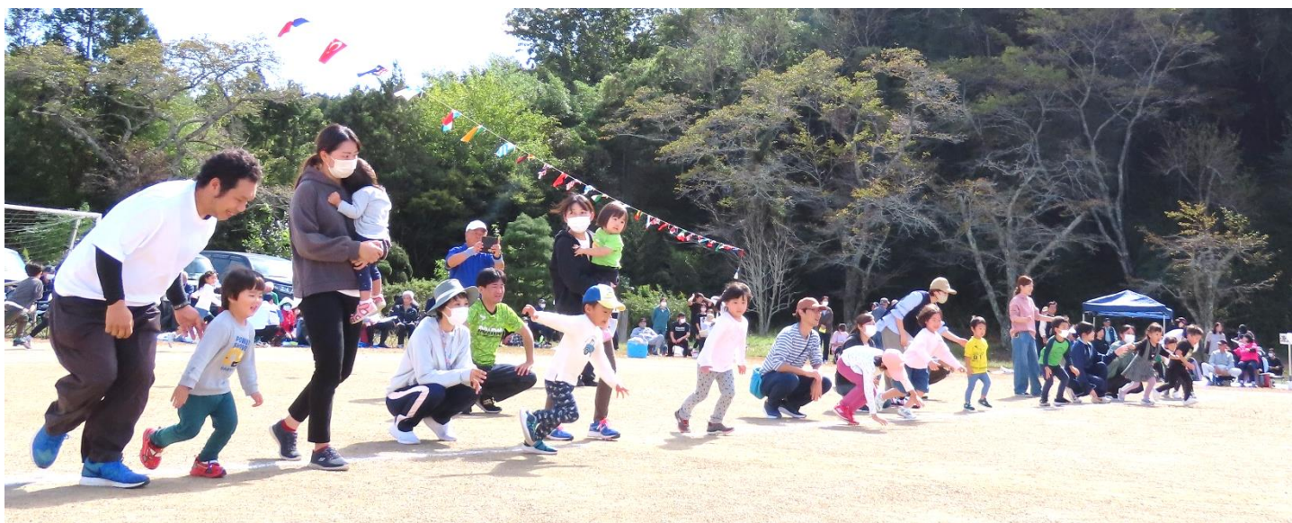
ごほうび目指して猛ダッシュ! 「もうすぐ1年生」