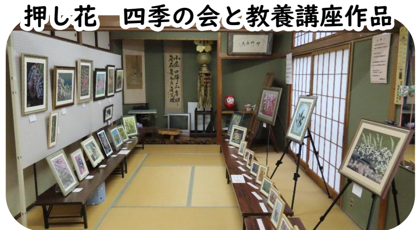
押し花 四季の会と教養講座作品