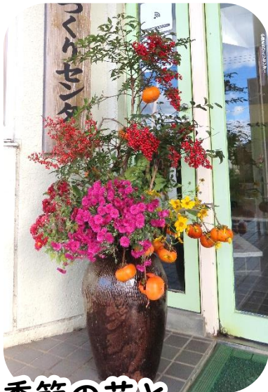
季節の花と、 うめえ～柿！