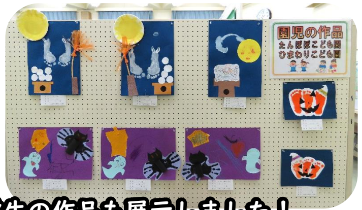
小斎地区の園児、小・中学生の作品も展示しました！