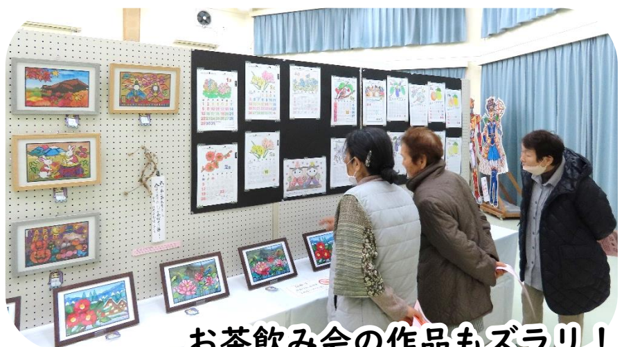
お茶飲み会の作品もズラリ！