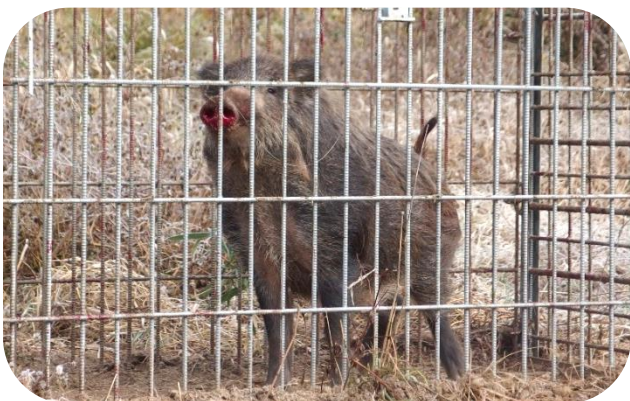
▲ 箱わなにかかったイノシシ (12/8 麓行政区内)

昨年度は「豚熱」が猛威を振ったことで町内のイノシシの捕獲頭数は、例年に比べてとても少ない結果になりましたが、今年度は徐々に戻りつつあるようです