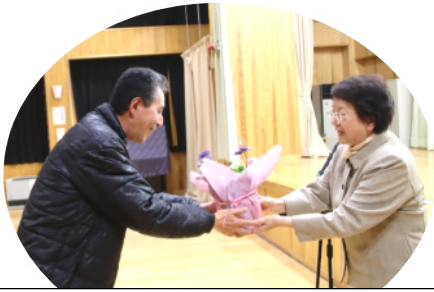
抽選に当選！おめでとうございます