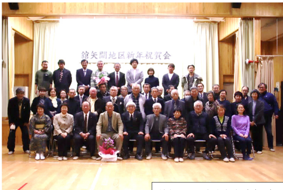
館矢間地区新年祝賀会(記念写真)