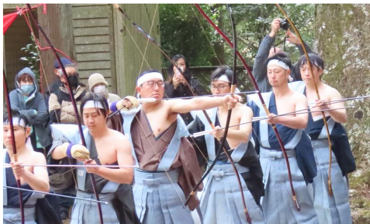
▲ 狙うは害鳥を模した「かりがねの的」