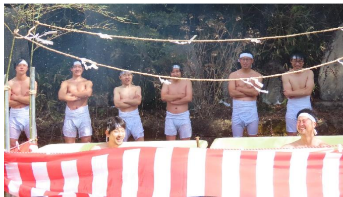
▲ 水垢離で身を清める弓士たち。

また、会場には出店コーナーも復活。コーヒーやピザ、焼き鳥、わたあめのお店が並び、にぎわいを見せていました。