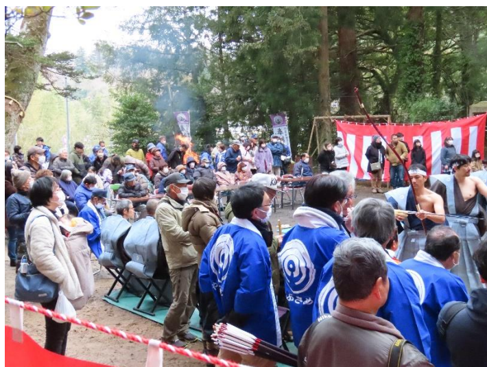
▲ 矢の行方を静かに見守ります。