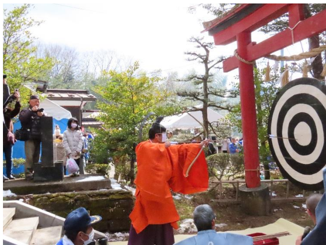
▲ 目隠して一年の天候を占います。