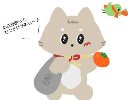
丸森町公式キャラクター ねこがみとうぐいすP

イベント告知 当日フリー券 + 専用入場券 + 抽選券 大人1,000円 小児500円（数量限定）