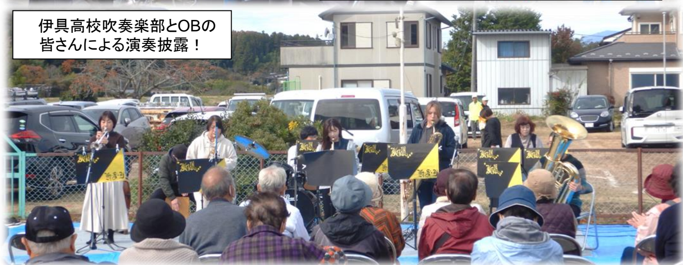
伊具高校吹奏楽部とOBの 皆さんによる演奏披露！