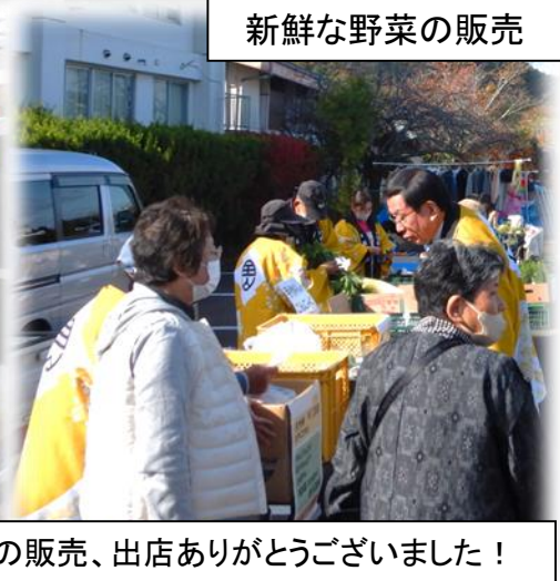
野菜や食品の販売、出店ありがとうございました！