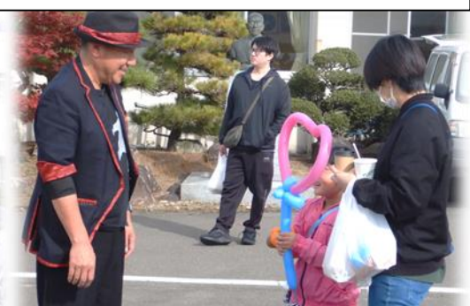
マジシャンはちまきさんのパフォーマンス。 風船やマジックで楽しませてくれました。