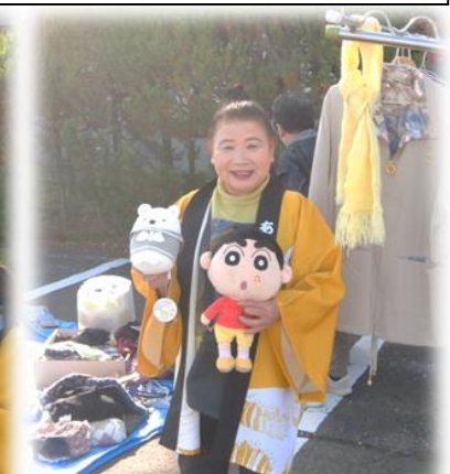
フリーマーケット、色々な物が並びます。