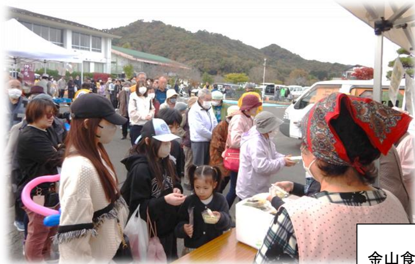
「おもち」の振る舞い。 金山食19会の皆さん、ありがとうございました。