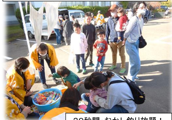
30秒間・おかし釣り放題！