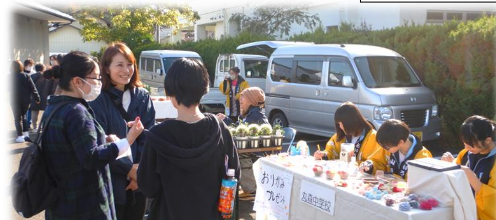
中学生による販売、また参加してくださいね！