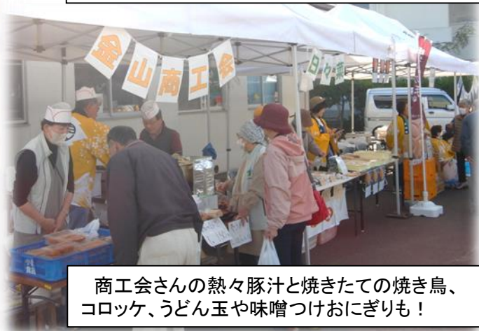
商工会さんの熱々豚汁と焼きたての焼き鳥、 コロッケ、うどん玉や味噌つけおにぎりも！