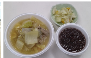
冬至カボチャ・豚汁・お漬物