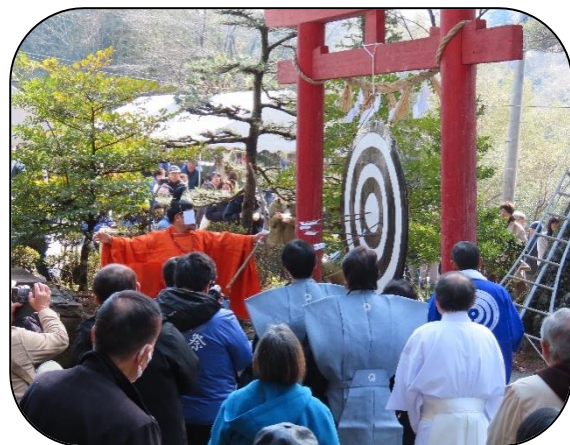
▲ 一年の天候を占う「御神的神事」