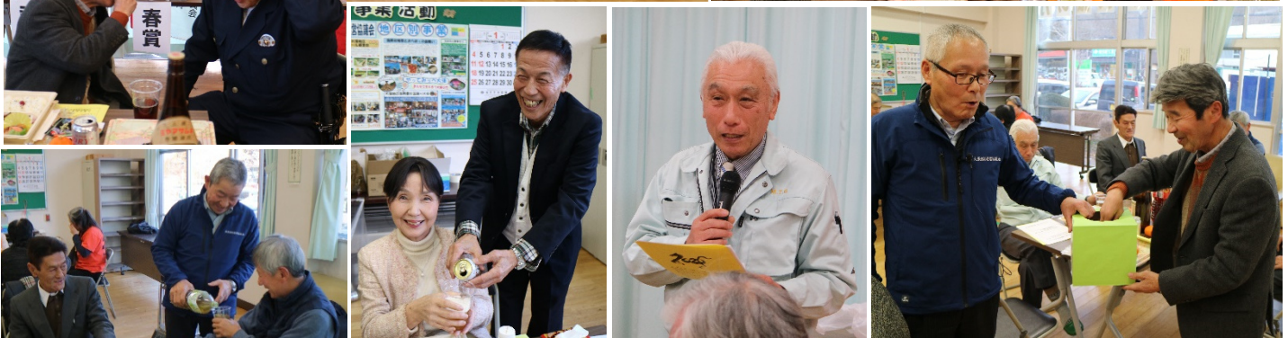
カラオケ愛好会の皆さんに「麦畑」「マツケンサンバ」「きよしのズンドコ節」を披露していただきました！