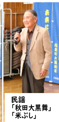
民謡 「秋田大黒舞」 「米ぶし」