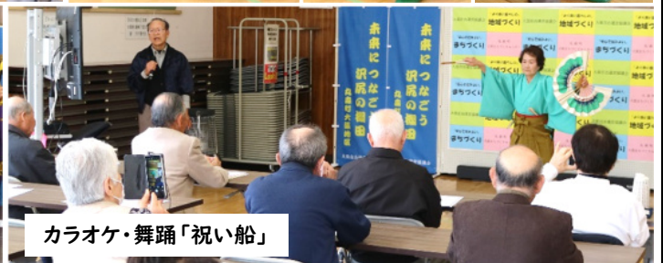
カラオケ・舞踊「祝い船」