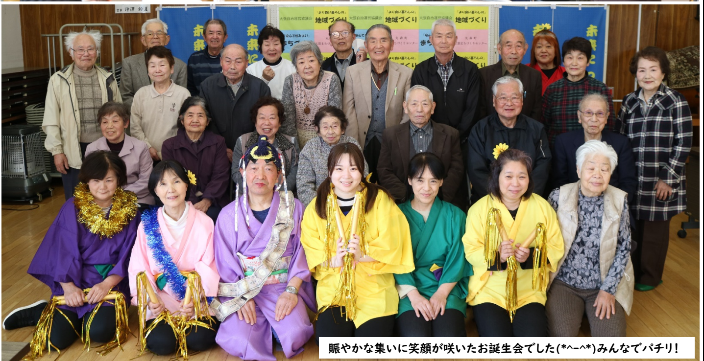
賑やかな集いに笑顔が咲いたお誕生会でした(*^-^*)みんなでパチリ！