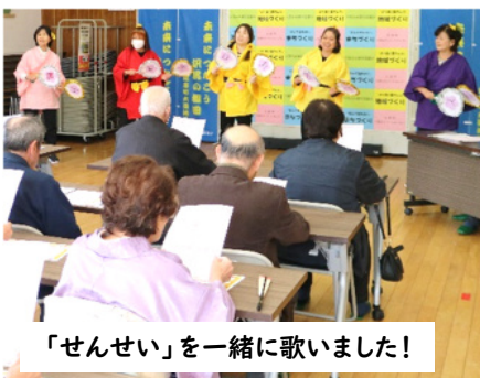
「せんせい」を一緒に歌いました！

3月24日(火)大張まちづくりセンターを会場に長寿会后期お誕生会が開催されました。地区ボランティア団体、大張カラオケ愛好会の皆さんが「仮装カラオケ」で駆け付けてくださり、趣向を凝らしたユニークな演出に元気をもらいました。また、会員による優雅で華やかな舞踊や心に染みる素晴らしい歌声の民謡、カラオケと踊りのコラボレーションを披露していただくなど、心温まるひと時に終始笑顔の絶えないお祝い会となりました。昼食は、愛好会の皆さんと一緒に！賑やかに会話を楽しみながら美味しくいただき、交流の深まる貴重な時間となりました。お誕生を迎えられた皆様、大変おめでとうございます。これからも元気で、一緒に楽しい時間を重ねていきましょうね(*^-^*)