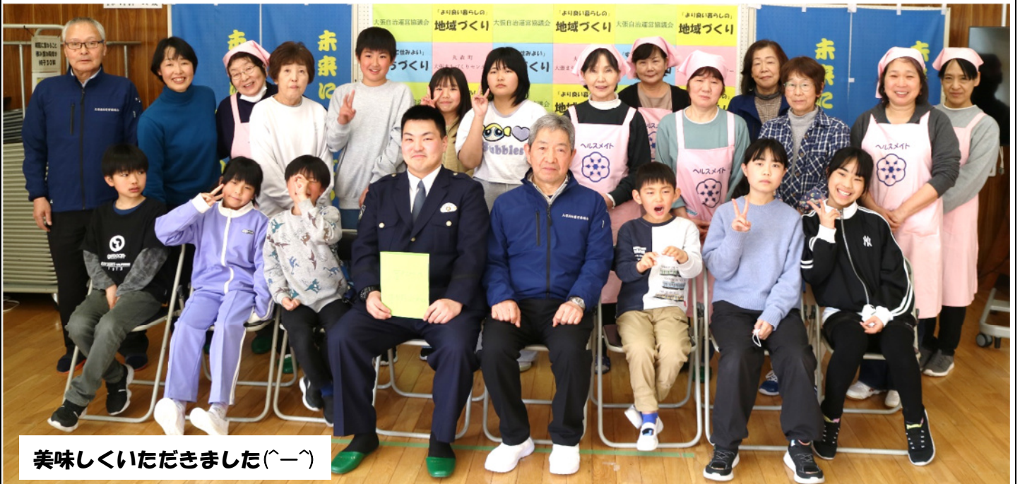
美味しくいただきました(^-^)