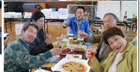
美味しい料理に会話も弾み楽しいひと時を過ごしました。