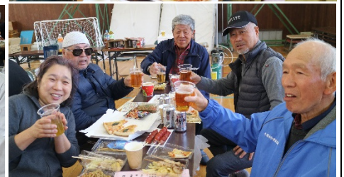
校庭は「桜満開」会場内は『笑顔満開』の桜を見る会でした！