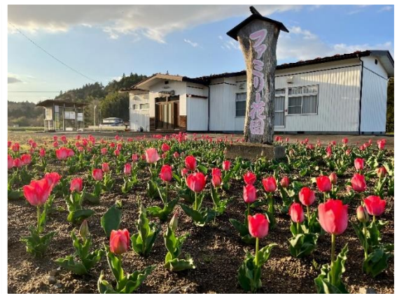
▲清水下ファミリー花園の花壇