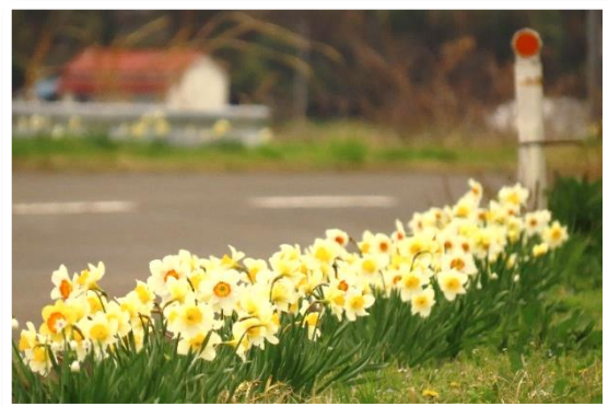
▲水仙ロード（弓目木）