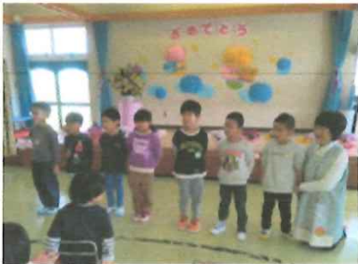
歓迎のことば〈ぞう組〉

4月3日（金）入所式・進級式を行いました。今年度は、新入所児1名を迎えて、ぞう組5歳児7名・3歳児3名、うさぎ組2歳児2名・0歳児1名の計13名でのスタートとなりました。子どもたちみんなでたくさんの活動を経験して、楽しい1年にしていきたいと思えます。保護者の皆様、地域の皆様のご協力をどうぞよろしくお願いいたします。