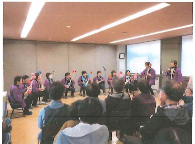
大内ボランティアの会の皆さんによる軽快でにぎやかなびん三味線の演奏。