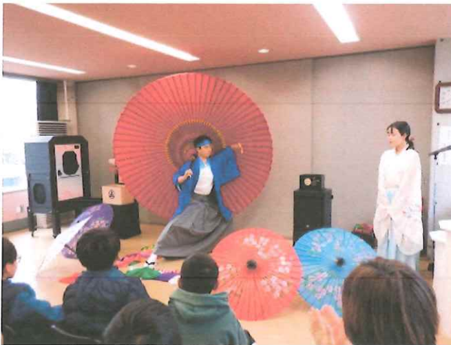
石巻市のパフォーマー妖術使いじゃがりこさん。あっと驚くマジックを次々と披露。

生きがづくり大内開催！ ドキドキワクワクの 楽しいマジックショーとびん三味線のお披露目です！