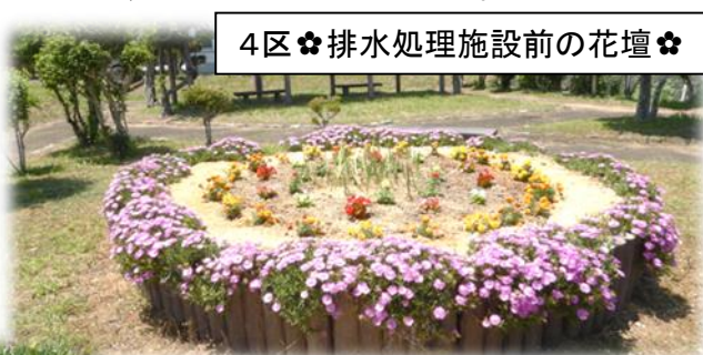
4区 ♡排水処理施設前の花壇♡