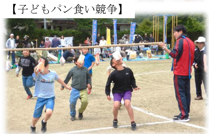
【子どもパン食い競争】